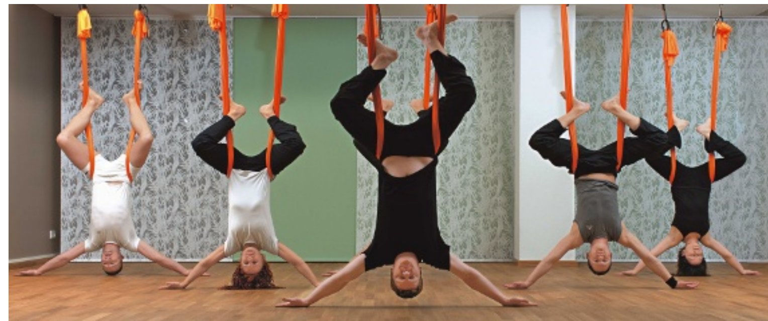
Luftnummer: Diese Übung heißt »Fliegender Hund«. Sieht noch einigermaßen machbar aus? Gleich heißt es die Arme an den Körper anlegen ...

TEXT _ MICHAELA ROSE